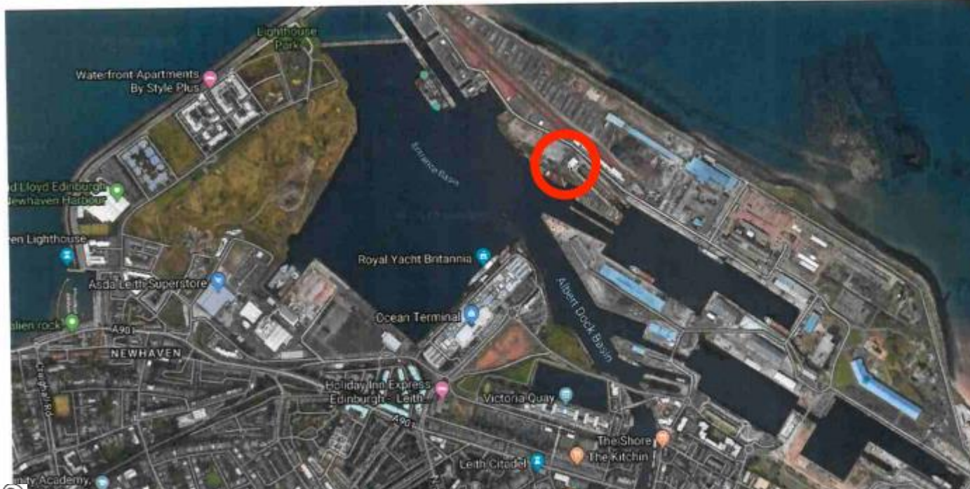
Google Maps Swansea Drydocks Ltd