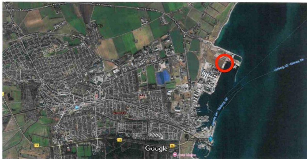
Immagini ©2019 Aerodata International Surveys CNES / Airbus DigitalGlobe Landsat / Copernicus, Lantmätaried/Metria Scankert 500 m