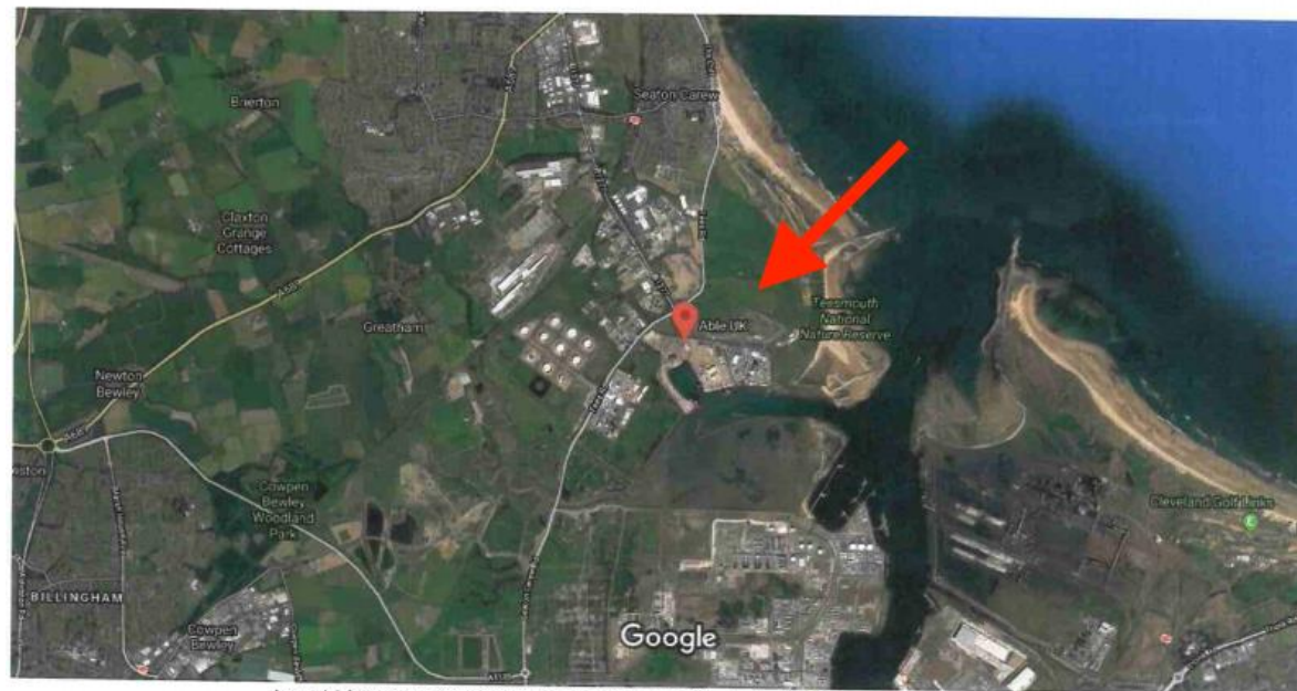
1 km